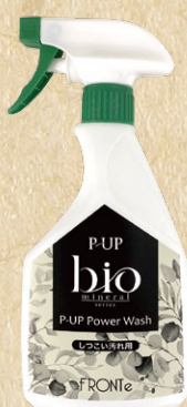
しつこい汚れ用(原液) 480mL